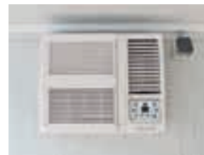
Klimagerät als Zubehör erhältlich