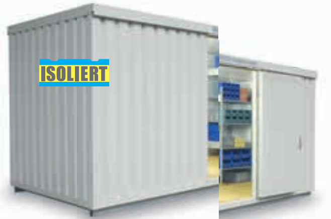
STIC 1500 (31931) mit Regaleinrichtung (nicht enthalten)