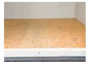
Isolierter Boden mit OSB-Platte